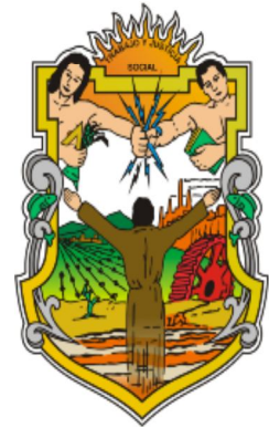
Escudo de Baja California Norte

navegante Francisco de Ulloa, quien recorrió ambos litorales de la península de Baja California entre 1539 y 1540, así como la costa del hoy estado de Sonora. Hernán Cortés quien ya había patrocinado tres viajes de exploración en la Mar del Sur (Océano Pacífico) y los cuales habían terminado en fracasos, decide enviar un cuarto viaje de exploración a la Mar del Sur al mando de Francisco de Ulloa en 1539. Partió la expedición del puerto de Acapulco el día 8 de julio del año citado a bordo de los buques Santo Tomás, Santa Águeda y Trinidad, a la altura de las Islas Marías se vieron obligados a abandonar el navío Santo Tomás, por lo cual continuaron el