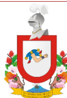
Escudo de Colima

Al cruzar con los suyos, un desfiladero en Colima los colimotes los atacaron por sorpresa, muriendo en la batalla Juan Álvarez Chico junto con otros españoles que fueron derrotados en la Batalla. Después de esta derrota la expedición punitiva fue confiada a Cristóbal de Olid que en 1522 fue