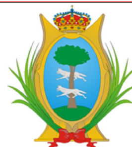
Escudo de Durango

sierra madre occidental, la zona del silencio, chupaderos, sus sets como villas del oeste son muy útiles para rodajes western. Hoy en día la ciudad es conocida como "Tierra del cine". Actualmente Durango es una ciudad de desarrollo medio que cuenta con muchos atractivos turísticos como su centro histórico, la feria nacional de Durango, su hermosa sierra, mexiquillo, museos llenos de historia, los sets cinematográficos.