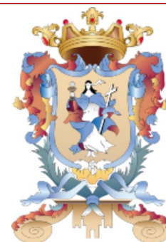
Escudo de Guanajuato