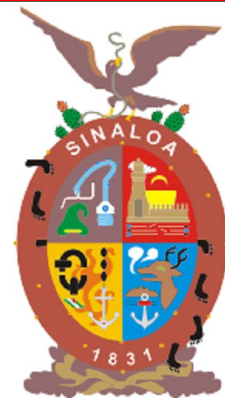
Escudo de Sinaloa