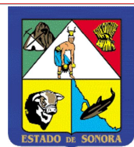
Escudo de Sonora