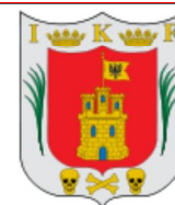
Escudo de Tlaxcala